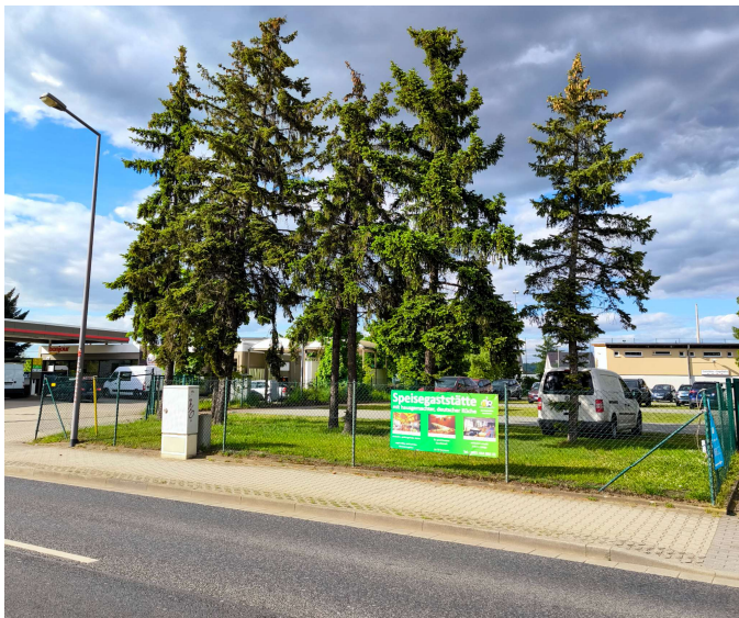
An der B6