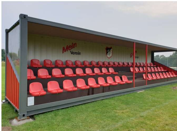
Projekt Tribüne am Kunstrasen