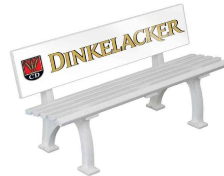
Sitzbank (z. Bsp.: für Trainer)