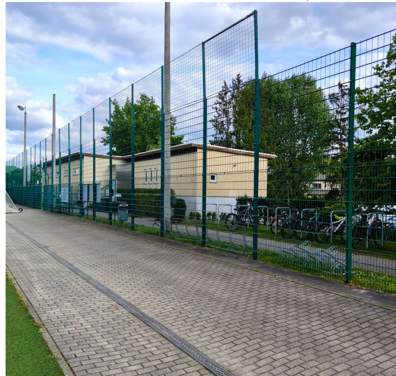
Zaun zwischen Zugang und den Sozialgebäuden