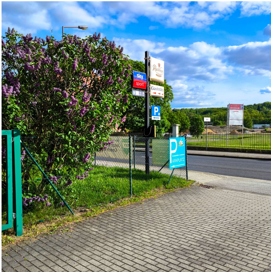
Zaun an der Ein- und Ausfahrt zur B6