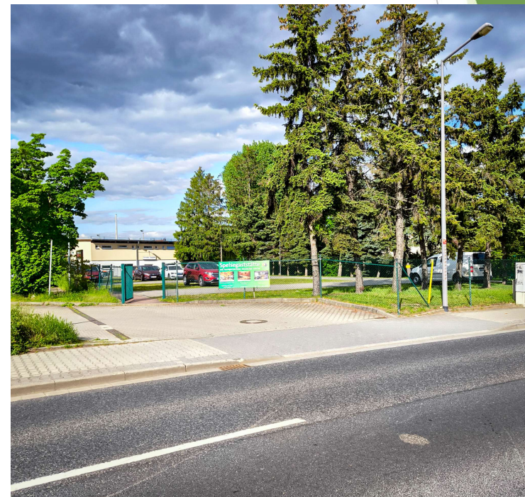
Zaun an der Tankstellenzufahrt