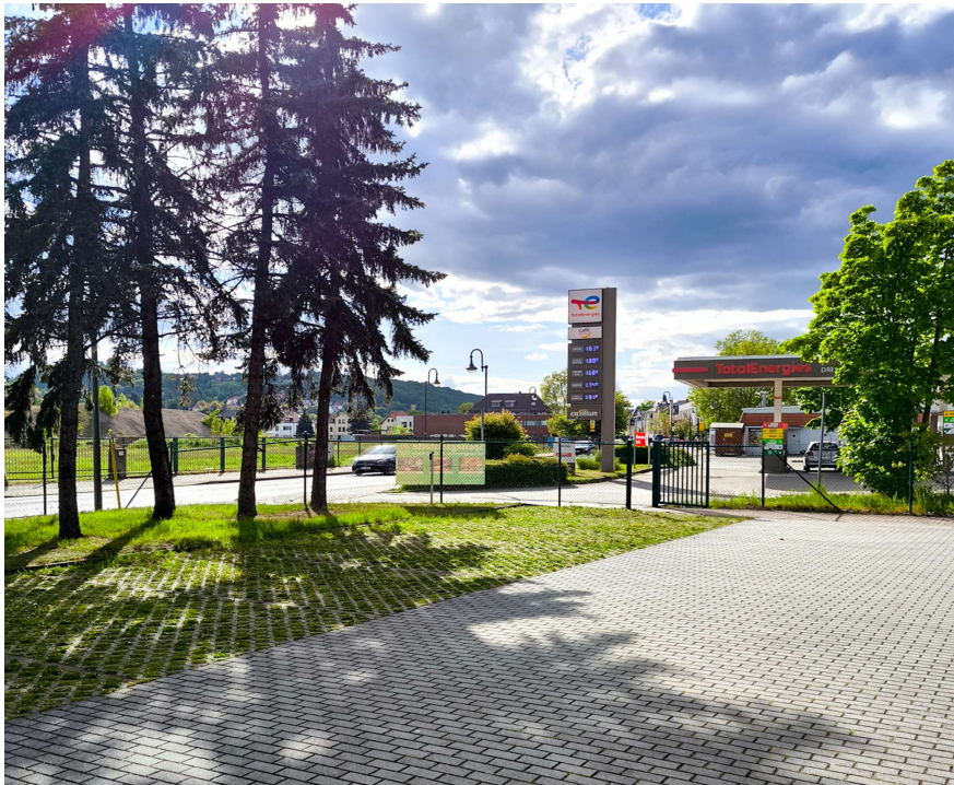
Parkplatz an der B6 und Tankstelle