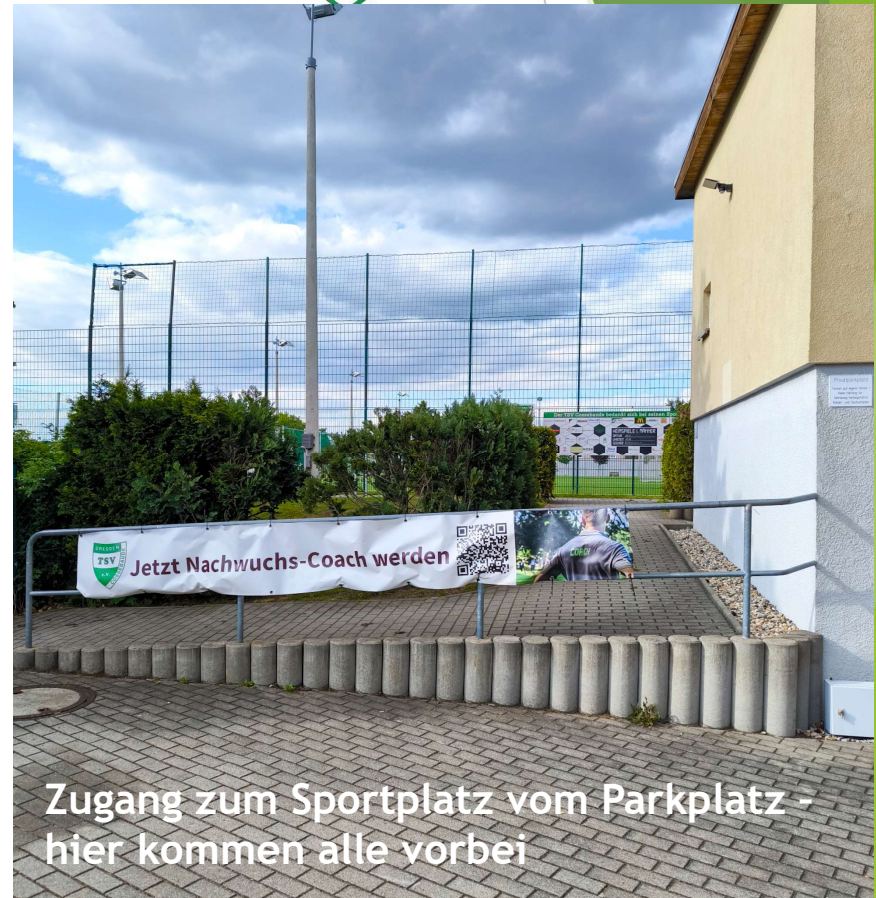
Zugang zum Sportplatz vom Parkplatz - hier kommen alle vorbei