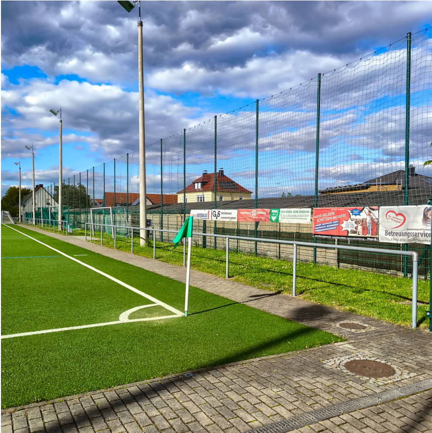
Ecke am Zugang Sportgaststätte