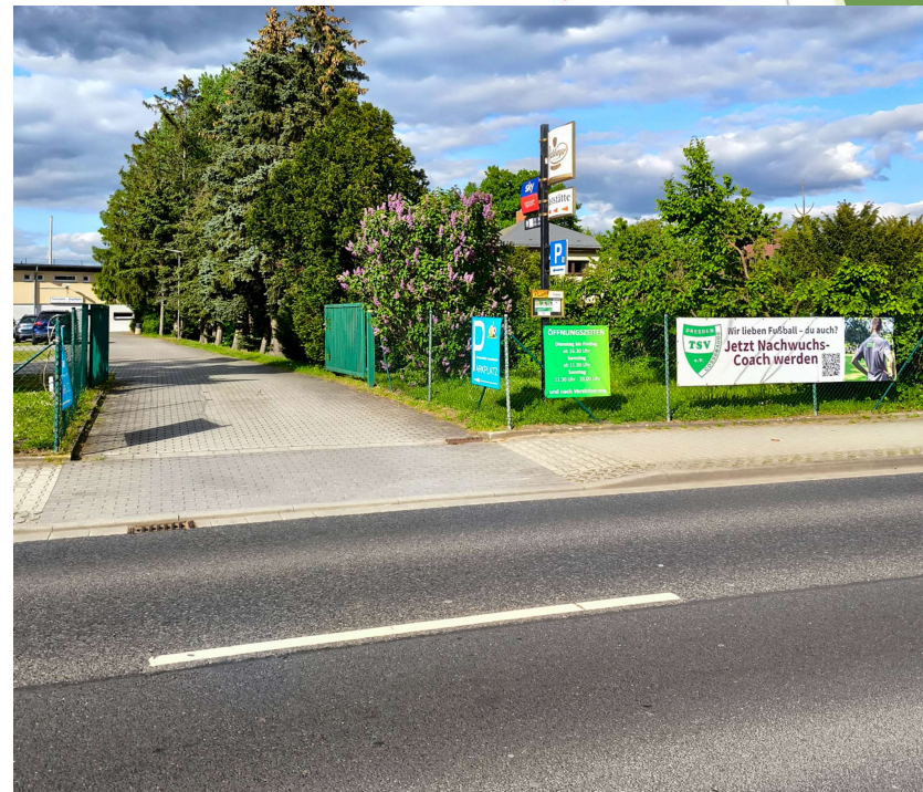
Einfahrt zum Parkplatz von der B6